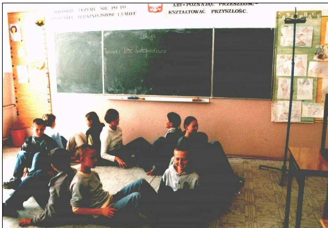
Fot. Przygotowanie do zajęć