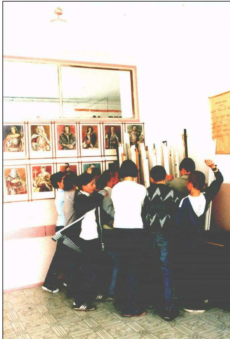
Fot. Atak na Belweder

Prezentację rozpoczynają słowa Wysockiego – fragment dramatu Stanisława Wyspiańskiego Noc listopadowa .