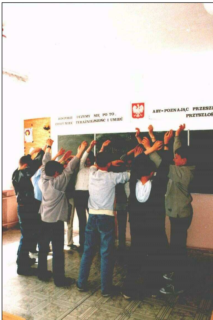
Fot. Przedstawcie dżysty, listopadowy dzień

Na znak nauczyciela uczniowie podniesionymi rękami prezentują chwiejące się na wietrze gałęzie drzew, przyginają się, nachylają, dźwiękami naśladują wycie wiatru, szumu deszczu, delikatnie przebierając palcami, uderzają w pulpity stołów, odtwarzają dźwięki padających kropli deszczu. Kilka skulonych, zziębniętych, szczelnie okrytych osób przemyka ulicą pod ścianami domów postaci.